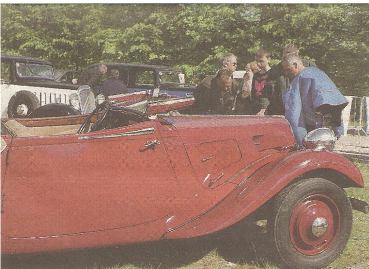
Les belles carrosseries de ces voitures des années 30 attirent toujours le regard

L'association, qui a cette année fêté ses 30 ans, compte actuellement une cinquantaine d'adhérents. Elle sera présente au vide-greniers de Gravenchon le 16 juin le 24 juin, ce sera la sortie club dans l'Eure, le 8 juillet la journée pique-nique surprise, puis, après les vacances, au Parc Expo de Rouen, le club aura un stand avec Citroën International et la bourse-échange de L'Aigle. L'année se terminera par une sortie de fin saison.